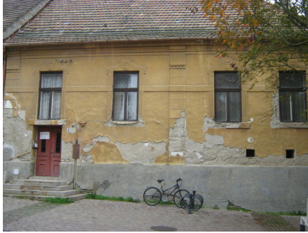
Eszterházy u. 8.

A rokonok szerint „gyönyörű szép, életvidám, művelt asszony” 3 1908. március 22-én kötött házasságot Glatter Jakabbal, a költő édesapjával. Ebből a házasságból született 1909. május 5-én Radnóti Miklós, akinek születése az anyácska és a sosem látott ikertestvér életébe került. A magát egy versében „győztes kis vadállatnak” 4 aposztrofáló költő erre a halálélményre és az anya nélküli gyerekkorra nem emlékezhetett, a tényekkel csak apja váratlan halálakor szembesült. „A kis család éppen Vácott volt akkor, az ottani rokonoknál töltötték a nyarat. Az apát onnan hozták vissza Budapestre, a Szabolcs utcai kórházba, ahol rövid ideig tartó szenvedés után, 1921. július 21-én meghalt. ... Nem sokkal halála után fiának azt is meg kellett tudnia, hogy az, akit addig édesanyjának hitt, csak nevelőanyja volt.” 5 Maga Radnóti így ír erről a 1939-ben befejezett Ikrek havá-